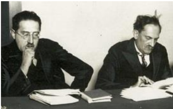
Basch Lóránt, Babits Mihály

A kérelmezők hosszú oldalakon részletezték megélhetési gondjait, szegénységüket, betegségüket, mely írói munkájuk legfőbb akadálya. Egyesek szemérmesen, alázatosan vagy éppen követelőzve jelezték igényüket, de voltak olyanok is, akiket a nyomor és a kétségbeesés ilyen sorok írására készítetett: ha nem érkezik segítség „halálba muszáj küldenem magam”; „Az öngyilkosság borzalmas réme néz velem szembe...”; „válasza élet - vagy halálosztás lesz...”.