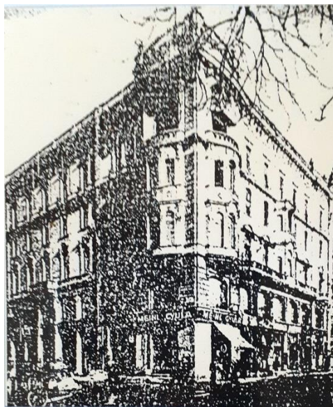
Az Alapítvány háza, Sas u. 1. (Budapesti Látogatók Lapja, 1890. 9. 20.)