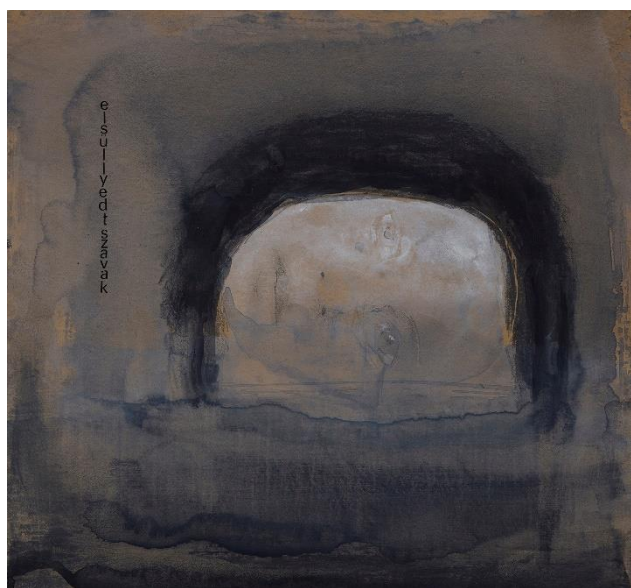
Az utolsó szó, 2023