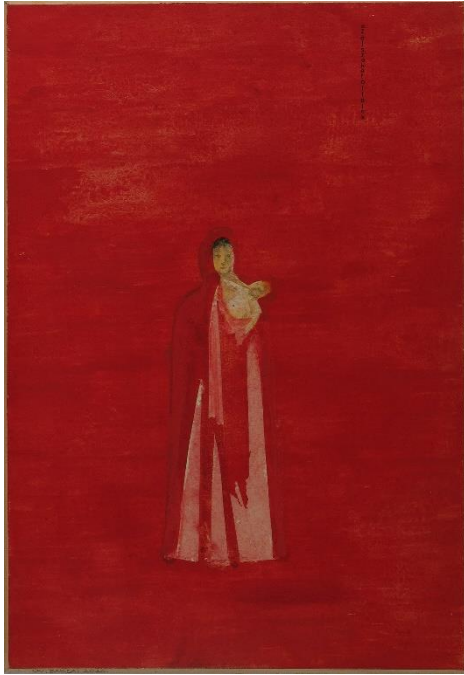
Védtelesen, 2020 296x205 mm

amely egyszerre őrzi és el is árulja titkait. A szürke és barna színek hol halvány, hol erősebb árnyalatai, a kontúrok laza tompasága, az alakok, a tér, amelyben megszűnik a kint és a bent nem más, mint a valóság kilátástalansága. Az itt kiállított képek mindegyike – más-más képi líraisággal – mintha egy hosszú út egyetlen állomása lenne. A valahonnan voltból a nem tudom hová jövőbe visz – szentendreiesen.