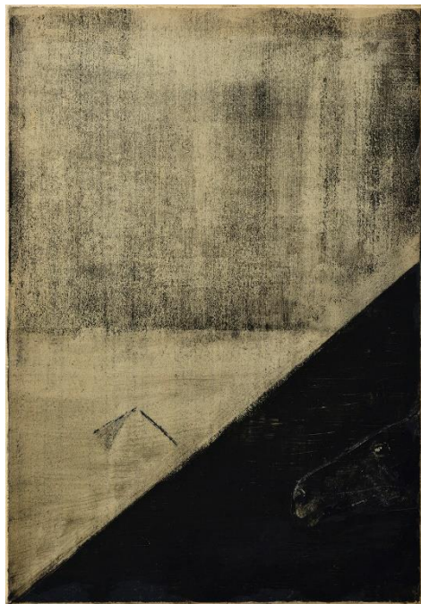
Szürke pára, 2021 296x206 mm

Alkotó módszere elmélyült és különös. Utazik, olvas – a külvilágtól kapottat a saját érzés- és gondolatvilágán átdolgozva veti papírra. Baksai minden műve több, mint szép látvány. Mindegyik megállít. El kell mélyedni benne, vizsgálni rajtuk a szépségen túlit. A realist a képzeletünkre bízta, a valóság fölöttit és az intimumot – amely az önmagunkkal való teljes őszinteséget takarja – megjeleníti.